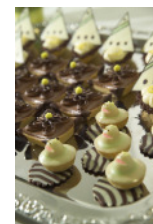
Kreationen Gewinner 2005

Für die Ausbildung sorgt das Richemont Luzern - nicht nur im klassischen Bäcker-, Konditor/ Confiserie-Handwerk. Mit zahlreichen ein- und mehrtägigen Seminaren zu den unterschiedlichsten Themen: von Produktions- und Verkaufstechnik über Marketing bis hin zu massgeschneiderten, auf die Kundenbedürfnisse zugeschnittenen Seminaren.